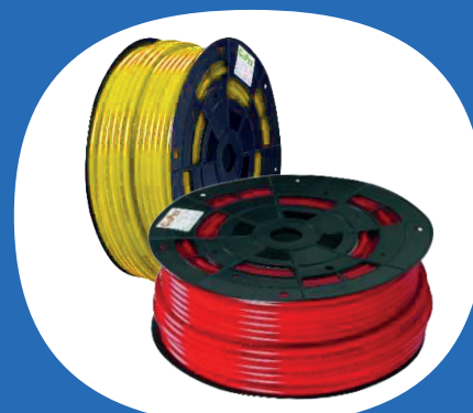
Tubi in polimero