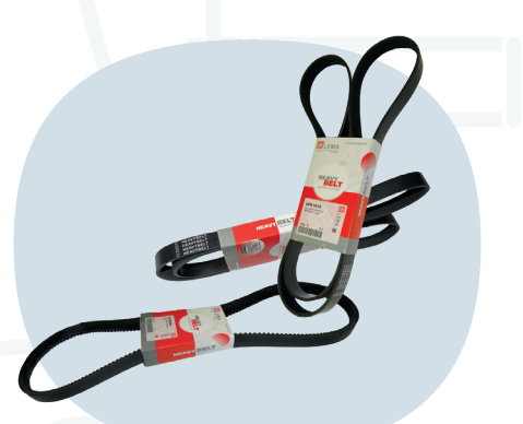
Cinghie di trasmissione