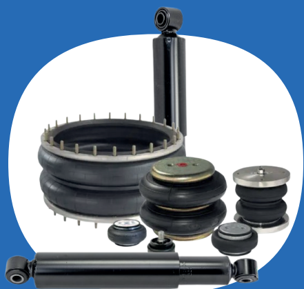
Sospensioni ad uso industriale