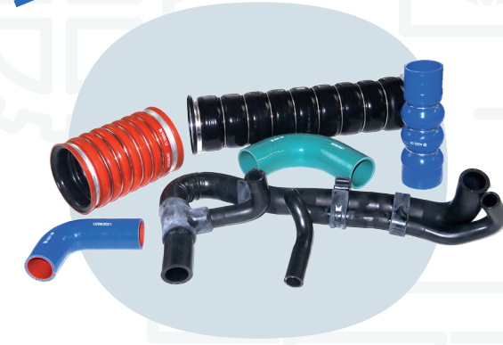
Tubi & Manicotti a disegno