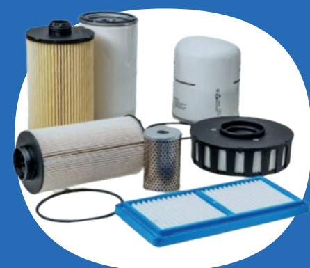
Filtrazione Olio e Aria