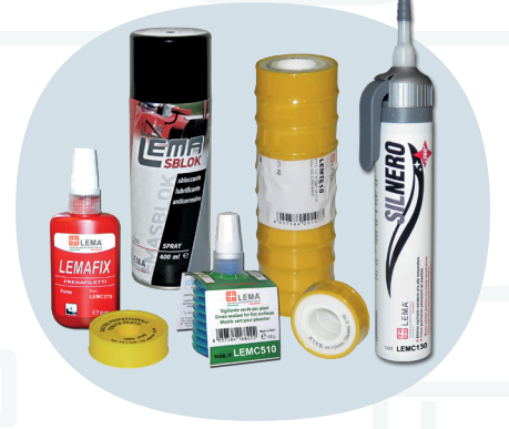
Guarnizioni & Tenute