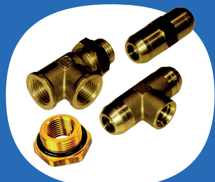
Raccorderia e Minuteria