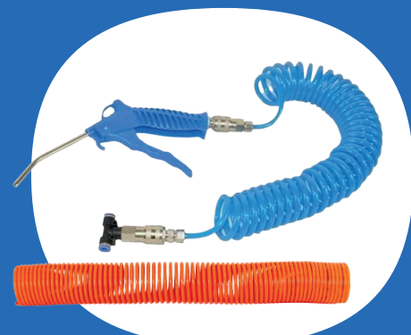
Tubi spiralati aria compressa e kit soffiaggio