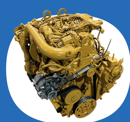
Motori industriali e componenti